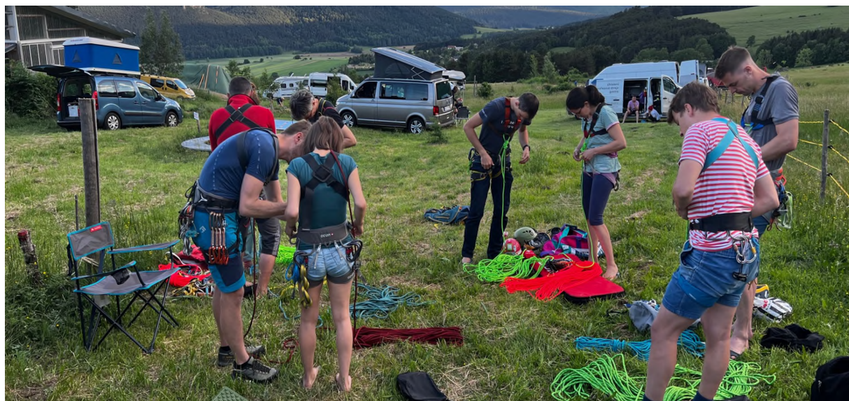
Foto: Kurz vícedélkového lezení Hohe Wand

Ve druhém červnovém týdnu se uskutečnil další výjezd určený výhercům outdoorové soutěže Mladí horalové. Tentokrát si lezecký pobyt užily děti z oddílu HK Lanškroun, které zvítězily v roce 2020.