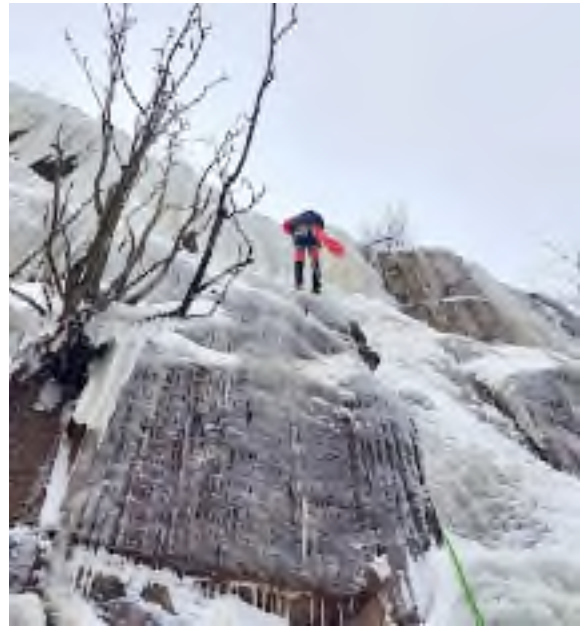
Foto: Seminář ledolezení v Krkonoších

Dle plánu a kalendáře probíhali také jednotlivé bloky a semináře instruktorských a trenérských kurzů.