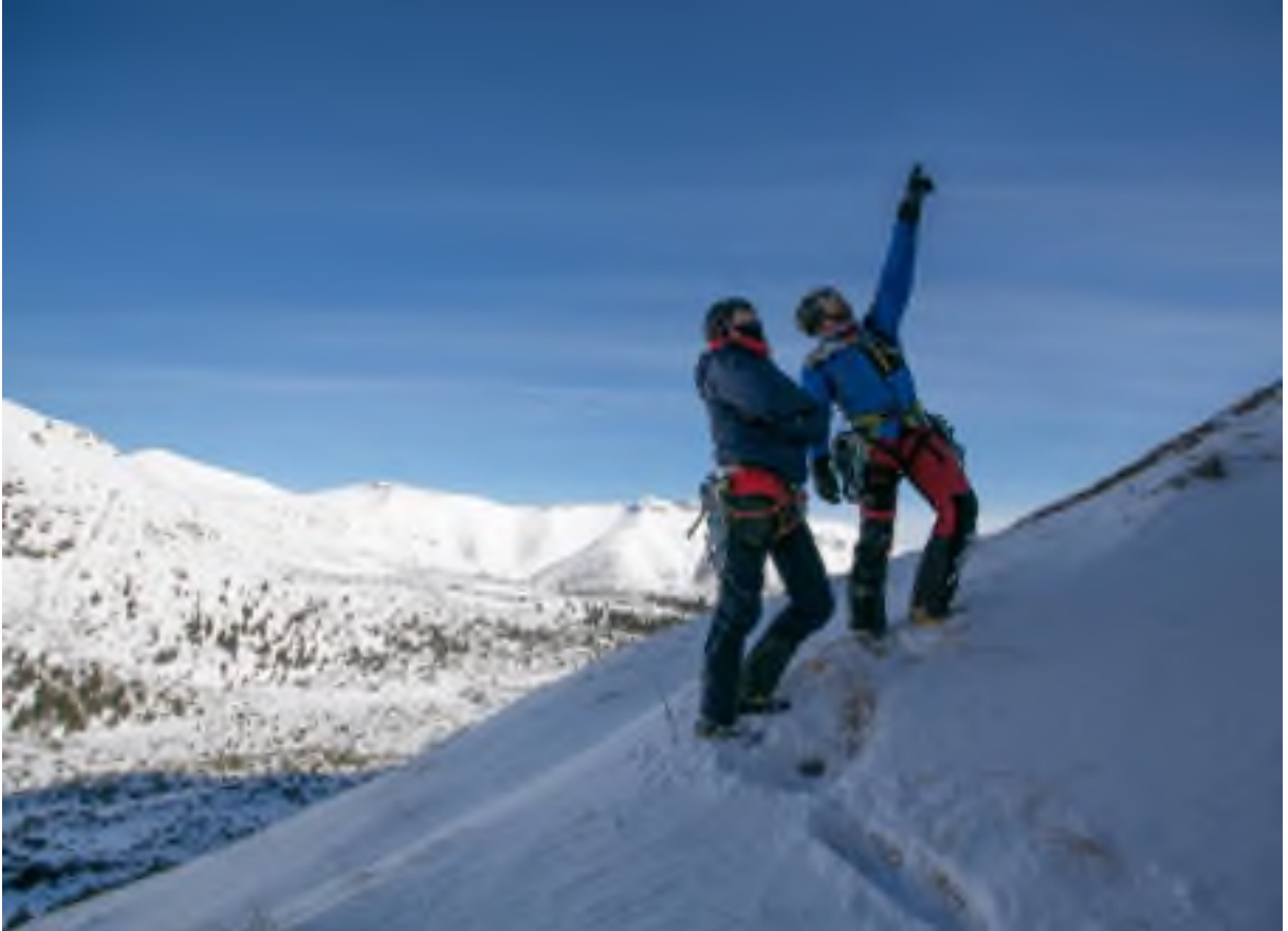
Foto: Zdeněk "Háček" Hák předával zkušenosti mladým Sokolíkům, autor: Standa Mitáč