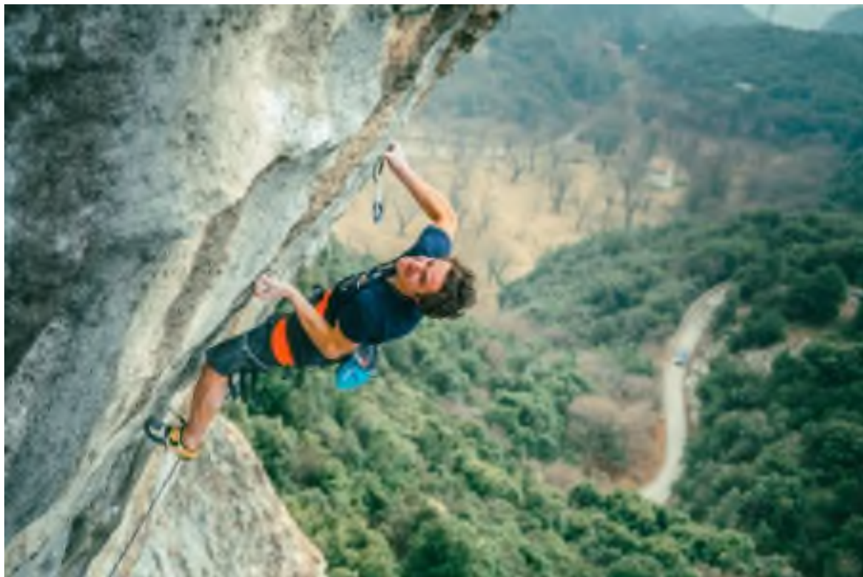
Foto: Adam Ondra v cestě Wonderland 9b