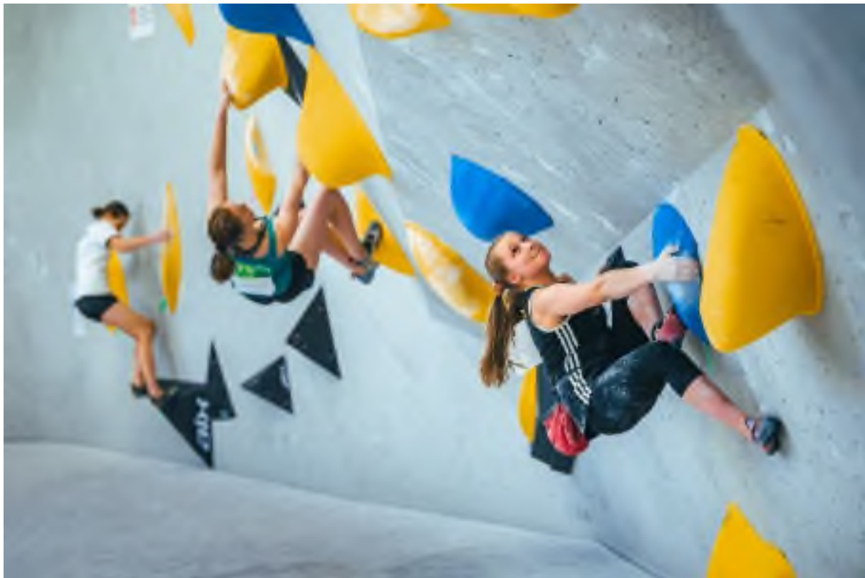
Foto: Finále 2. Kola ČP v boulderu 2022

Poslední únorový víkend (26.-27. 2.) jsme v tréninkovém centru Jungle Letňany rozběhli kolotoč závodní sezóny 2022, a to hned dvěma prvoligovými závody. V sobotu proběhlo 1. kolo ČP a nominační závod v boulderu dospělých a mládeže, v neděli následovalo 1. kolo ČP v boulderu pro kategorie U14. V kategorii dospělých zvítězili dle očekávání Eliška Adamovská a Martin Stráník. Elišce šlapala na paty také Markéta Janošová, která stejně jako Eliška topovala všechny finálové bouldery, ale na více pokusů. Vítězi v dalších kategoriích se stali Markéta Janošová, Gergő Vályi (HUN) (J), Valerie Pařilová, Marcell Tóth-Magériusz (A) Viktorie Konečná, Lukáš Mokroluský (B), Nikola Barošová, Lukáš Uhrec (U14), Veronika Harmáčková, Maxmilián Suchan, David Suchý (U12), Marie Skřičková, Vojtěch Ambroz (U10).