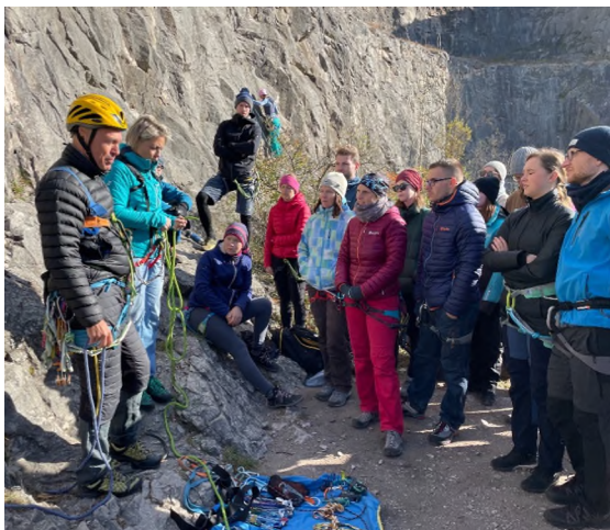
Foto: Metodický den ČHS, Srbsko

V průběhu posledního čtvrtletí se podařilo dokončit instruktorské kurzy CWI (instruktor lezení na umělé stěně) a SCI (instruktor sportovního lezení), jejichž průběh zpomalily covidové restrikce. Dokončen byl také kurz Trenér B a došlo k otevření kurzu Trenér C .