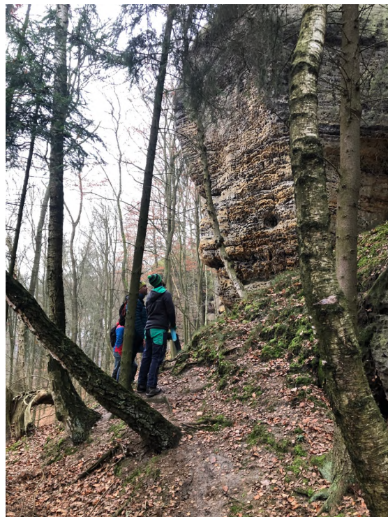
Foto: Obhlídka terénu, Mladí horalové 2022

V neděli 28. 11. začaly přípravy dalšího ročníku soutěže Mladí horalové. V Kokořínském dole se setkali zástupci Komise mládeže ČHS se zástupci pořadatelských horolezeckých spolků HO Satalice a LK Mšeno, aby společně vyrazili na první obhlídku skalních terénů a následně diskutovali možné varianty závodní trasy a případné vytvoření dvou různých závodních okruhů.