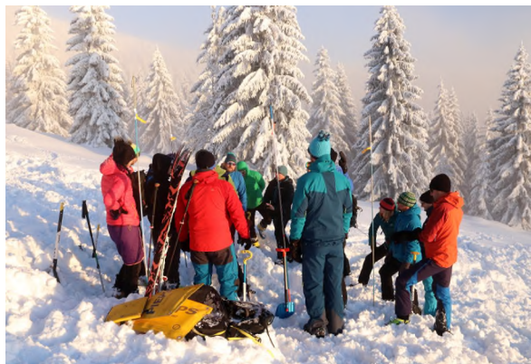
Foto: Workshop Lavinové problematiky na Setkání skialpinistů