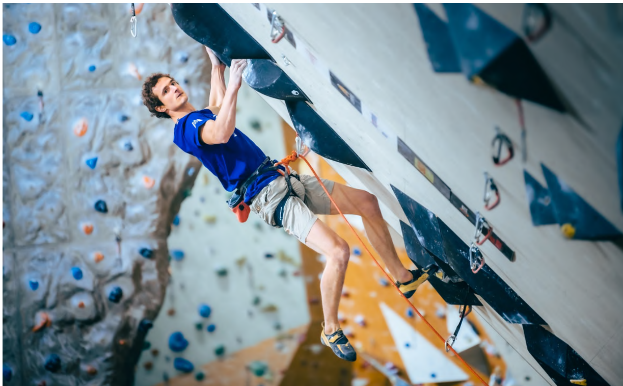
Autor: Petr Chodura, Adam ve finálové cestě MČR

O víkendu 16.-17. 10. proběhly na HUDY stěně v Brně hned dva mistrovské závody 2021. V obtížnosti závodili mladí lezci kategorií U14 a v lezení na rychlost pak mládežníci i dospělí. První den se na MČR U14 v lezení na obtížnost sešlo 89 malých závodníků, aby se "poprali" o tituly mistrů na parádních cestách od stavěčského tria ve složení Viktor Pařízek, Michal Kalvas a Olina Stehlíková. Druhý den pak proběhlo Mezinárodní mistrovství České republiky dospělých, Mistrovství České republiky mládeže a Mistrovství České republiky U14 v lezení na rychlost. Závodů se zúčastnilo 73 závodníků, z toho 49 závodníků v kategorii U14 a 24 závodníků v kategorii mládeže a dospělých.