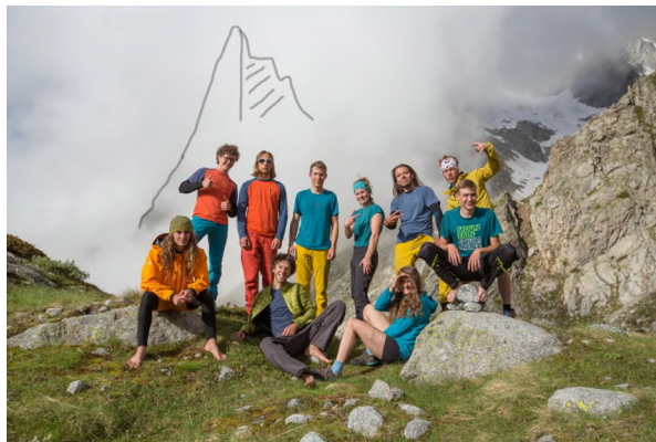
nová parta Sokolíků