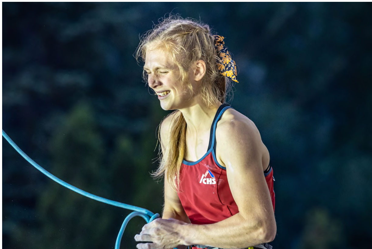
Autor: Jan Virt, Eliška po finálové cestě na SP Briancon