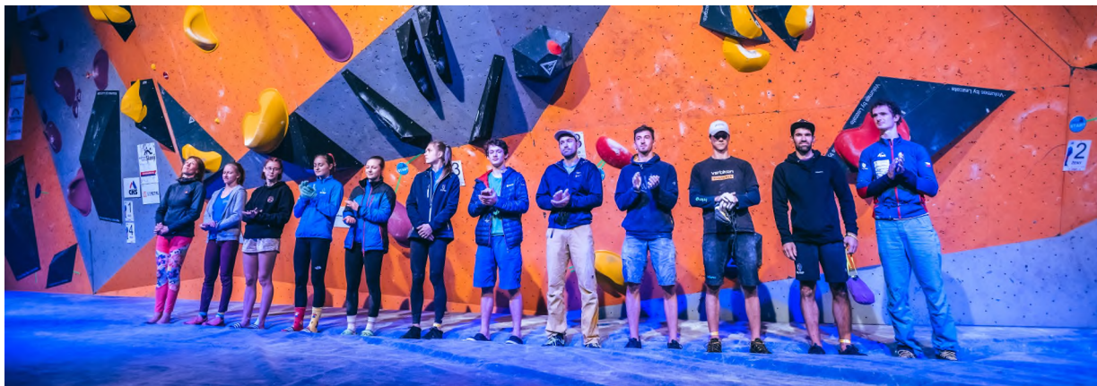
Autor: Petr Chodura, finalista MČR