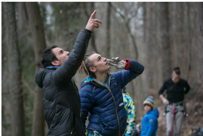
Nábor Sokolíků

Během následujících tří let absolvuje osmičlenné družstvo pod vedením zkušených (horo)lezců řadu výjezdů do skal a hor nejen v Česku ale i v zahraničí.