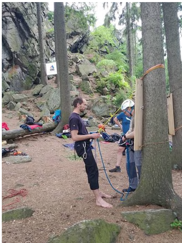
Metodický den na Drátníku

První vzdělávací akce a kurzy proběhly kvůli covidu až koncem května a začátkem června. Na konci května proběhl doškolovací kurz na Rabštejně, zaměřený na postupy při výuce nováčků, přihlášeno bylo 8 zájemců, z nichž 7 úspěšně prošlo kurzem a 1 se nedostavil. Začátkem června proběhl další doškolovací kurz, tentokrát na téma jak připravit děti na lezení v horách, kterého se zúčastnilo 13 osob. Dále se konal lezecký metodický den na Drátníku, kterého se zúčastnilo 16 osob.