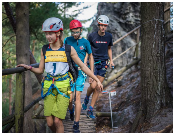
Mladí horalové na Malé skále, autor: Tomáš Srb

Jednou z nejvýznamějších mládežnických akcí ČHS je outdoorová soutěž Mladí horalové. Čtyřčlená družstva z lezeckých oddílů zapojených do Sítě mládežnických klubů porovnávají své nejen lezecké schopnosti nejprve v rámci oddílového kola a ti nejlepší následně v rámci celoostátního finálového závodu. Přihlášky se podávaly do konce června a finále proběhne 18. 9. v Babím lomu. Organizátory jsou pro tento rok HK Babí lom Kuřim a Ležčata