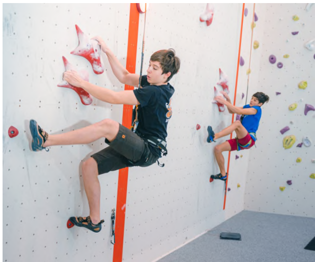
Autor: Petr Chodura