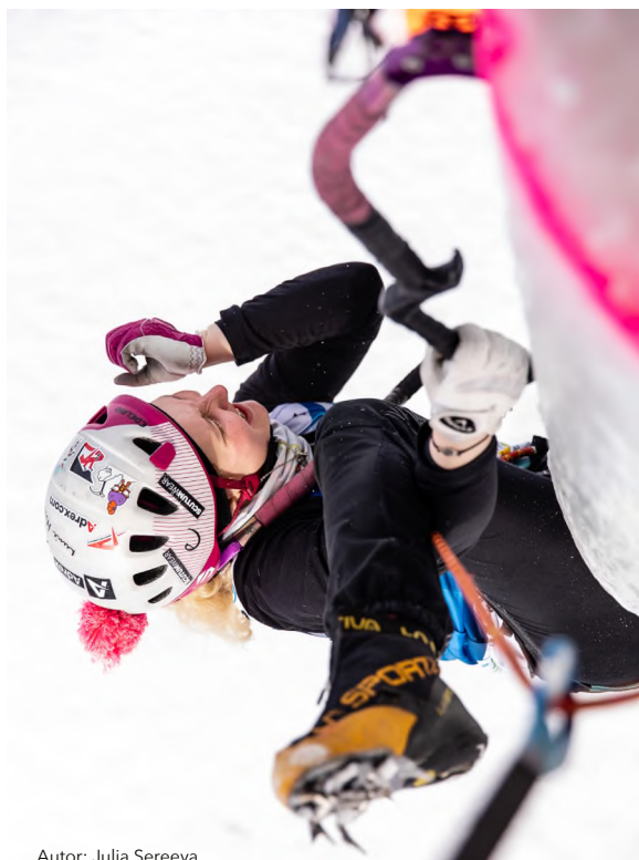
Autor: Julia Sereeva