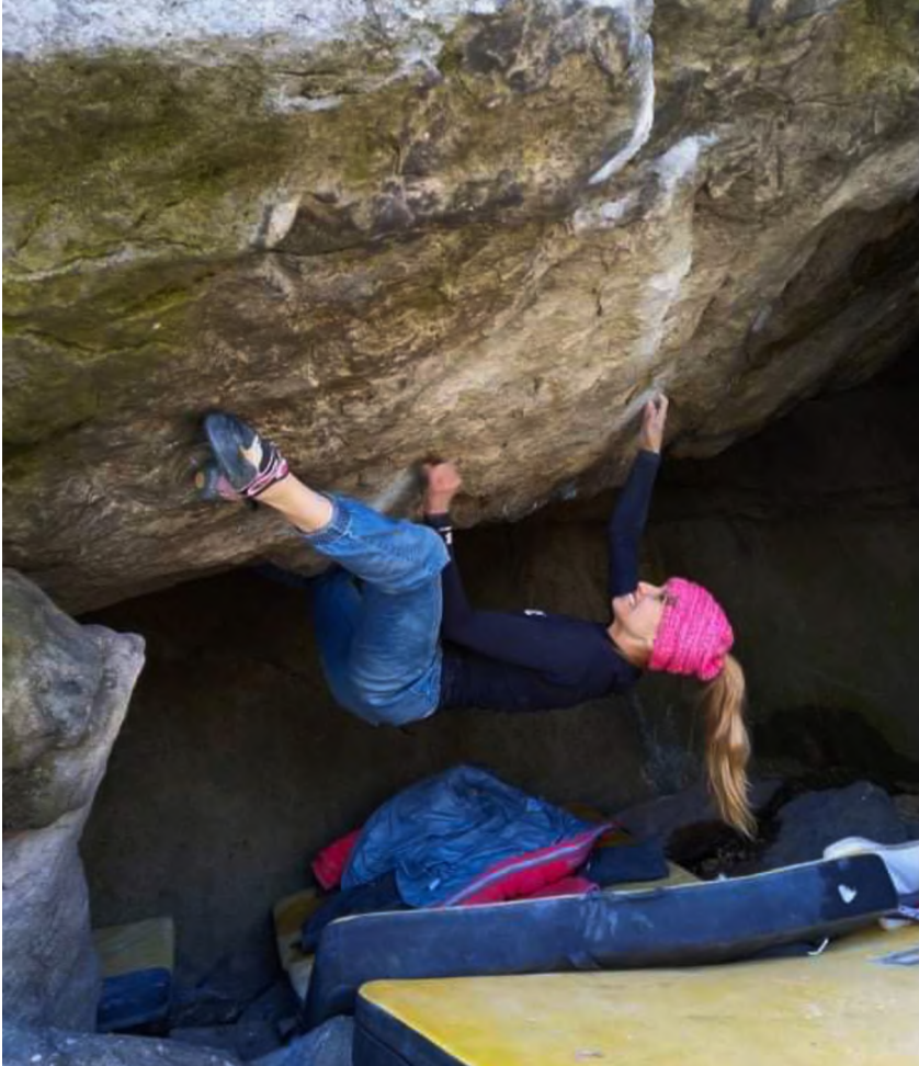
Autor: Archiv Lucky Hrozové